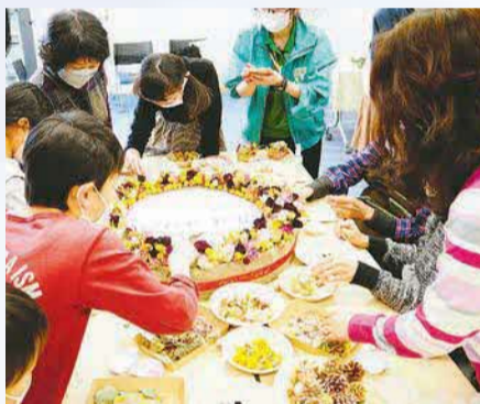
▲昨年のワークショップの様子