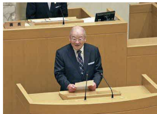
▲就任あいさつをする北野氏