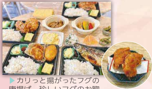
▶カリッと揚がったフグの唐揚げ。珍しいフグのお惣菜も!

おいしいような総菜がお店にたくさん並んでいます♪種類が多くて迷ってしまうほど。ボリューム満点のお弁当も充実していて、忙しい毎日の強い味方です。店長さんが腕を振るうフグ料理やオードブルは予約できるので、お祝いやホームパーティーにもピッタリです!