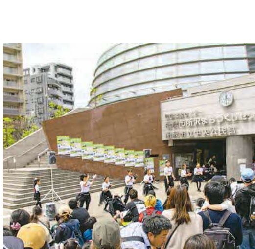
▼5月14日(日)に中心市街地にて、とことこタワーまつりが開催。和太鼓やダンスの発表をはじめ、ゲームコーナーや飲食ブースも設置され、子どもから大人まで楽しめる空間になっていました。