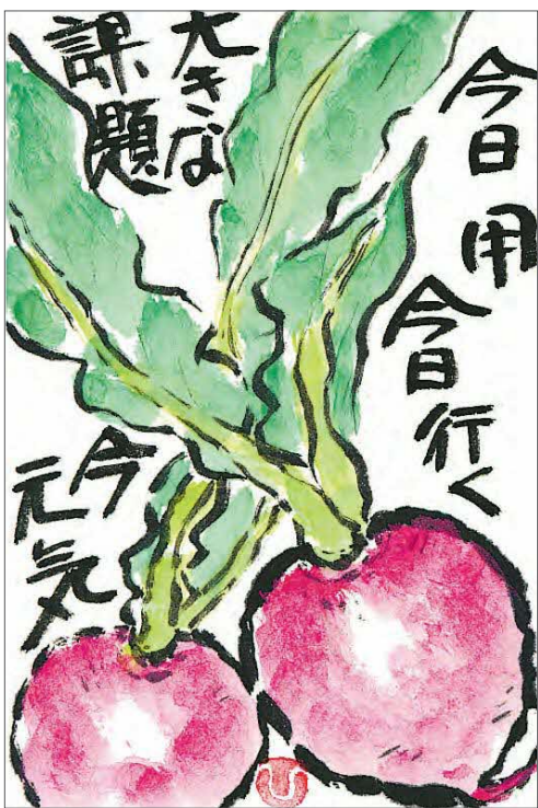
▲今日用 今日行く 今日用事があって、今日行くところがあることは生きがいのために大切なことです ●井上博子(上安松)