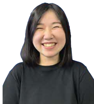
▲砂金主事 (高齢者支援課)

事務職 市役所の仕事は市民の生活の基盤になるものが多く、責任も感じますが、それ以上にやりがいのある仕事です。市民の方から感謝の言葉をいただくと、「頑張ってたかったな」「これからもっと頑張ろう！」という気持ちになります。