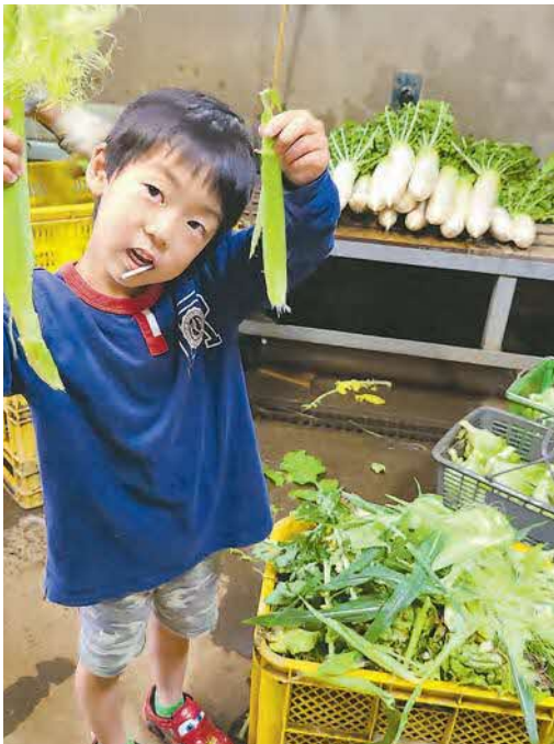
▲初物 ヤングコーン採れました。甘くて好きなんだー！ ● young corn (下安松)