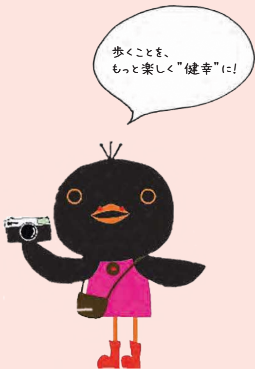
◆所沢市広報マスコット ひばりちゃん