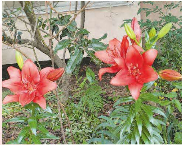
▲透かし百合 突然変異！？ 百合は三枚三枚の六枚の花弁なのですが、写真左側の透かし百合赤は、四枚四枚の八枚の花弁です ●つちのとのと(下富)