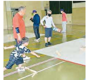
◀5月21日(日)に小手指地区体育館で小学生ラケットテニス&モルック体験が開催。参加者同士でコミュニケーションを取りながら、試合を楽しんでいました。