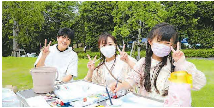
▲5月14日(日)にとこざわサクラタウンと東所沢公園で開催された子ども写生大会。参加者は思い思いの題材を画用紙いっぱいに描いていました。