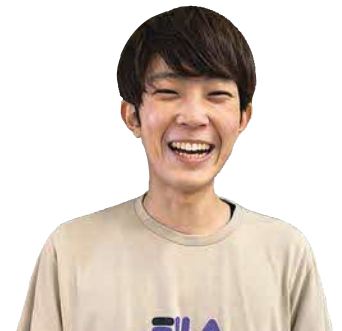
▲小倉保育士 (松郷保育園)

また、保育園に着いて子どもたちが「おはよう！」と元気よくあいさつしてくれることも、その日1日のやりがいになっています。