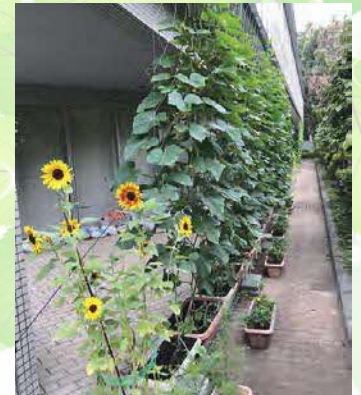
昨年度の入賞写真