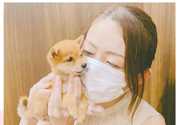
▲新しい家族です！ 天使のような豆柴がうちの子になりました ●RIRA(元町)

▶ hiroba@city.tokorozawa.lg.jp 〒359-8501 広報課みんなのひろば (住所不要)