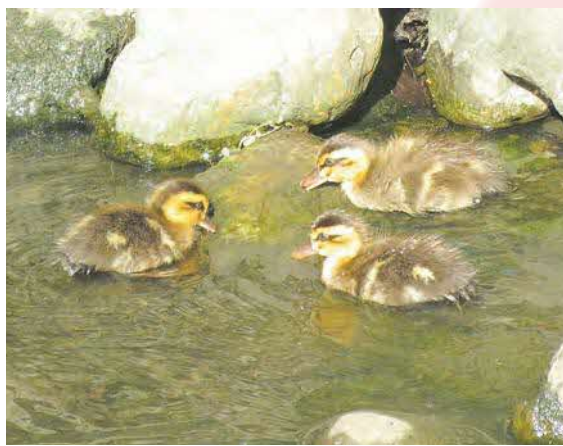
▲親にはぐれた3羽のカルガモのひな なんとか大きくなってもらいたいと願うばかりです ●みーはる(牛沼)