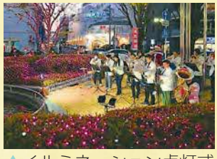
▲イルミネーション点灯式

新所沢まちづくり協議会は、平成26年7月に設立し、自治会や地域の支部、商店街などの団体で構成され、「新所沢をよくしたい」という共通の思いで様々な活動を行っています。令和4年8月には「しんとこ子ども盆踊り」、9月には「しんとこフェス」を実施し、大人から子どもまで楽しめるイベントとして、たくさんの方が参加し大いに盛り上がりました。また、新所沢といえば12月から1月にかけての「新所沢イルミネーション点灯事業」。すでに4回を数え、新所沢の冬の風物詩となっています。開始前には有志ボランティアで「噴水清掃」も行い準備万端。新所沢駅西口の駅前を色とりどりのライトが照らし、通る人々の心を明るく幸せな気持ちにしていることでしょう。