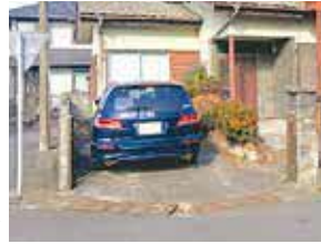
▲空き家の駐車場を活用

近年、空き家が目立つようになり、防犯が課題になっている。加えて近くのコインパーキングが閉鎖し、路上駐車が増加しており、歩行者に危険が及ぶことが問題視されている。これらの悩みを解消するために、「空き家駐車場の活用」を実施している。空き家の所有者に敷地内駐車場の自治会での利用ををお願いするとともに、使用貸借契約を交わしている。利用の用途は、親戚・友人、リフォーム工事車など。この取り組みで違法駐車を減らし、地域の防犯対策と空き家の維持管理をすることで、安全安心な地域づくりを目指している。