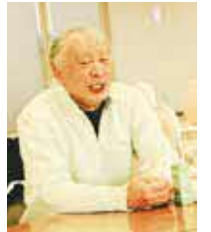
▲「根っから地域活動が好きだったのかも」と活動当時の思いを振り返る

一人住まいの高齢者の面倒を誰が見るのか？という問題意識があります。高齢者へのケアを大切にして、地域内でしっかりとコミュニケーションを図ることで、孤立を作らない、あたたかい地域を作りたいです。自治会活動は自分の人生の経験を活かせる一番身近な活動です。