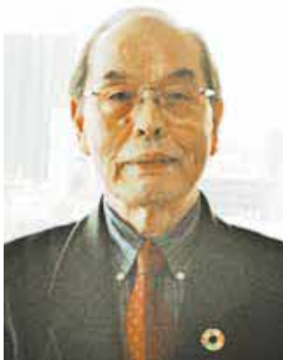
新所沢団地自治会 古屋会長