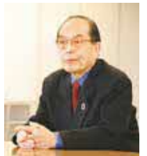
▲「一人の10歩より10人の一歩から」を胸に日々活動している

自治会活動が曲がり角に立っており、活動の活性化と現役世代でも活動に参画できる仕組みが必要です。いざという時の自助・共助体制の充実のためにも若い力は必要であり、若い人と共に活動をしていきたいです。そのためにも手を煩わせない工夫(会費などのコンビニ払いやキャッシュレス払い)が今後重要です。