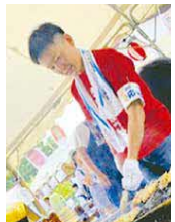
▲職員も夏祭りに参加(上岩岡自治会夏祭り)

自治会・町内会を応援するため、市では、「所沢市地域がつながる元気な自治会等応援条例」を制定しています。応援活動の一つとして、市の職員による「自治会・町内会応援団」を結成。ボランティアスタッフとして自治会・町内会の夏祭りに参加し、地域活動を実際に体験しながら応援しています。出店の販売のお手伝い、お神輿の担ぎ手など、応援する活動はさまざま。職員それぞれが、地域を盛り上げるための力になりたいという思いで活動しています。