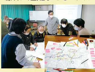
▲講習会の様子と逃げ地図

自然災害が起きたとき、自宅からどの道を通って避難するか、途中にどのような危険が潜んでいるか。山口地区では地域の皆さんが集まり一緒に考える「逃げ地図をつくる講習会」を実施しました。安全な場所に避難するまでのルートを、子どもや高齢者にも分かりやすいように、地図上に具体的に書き込んで可視化していく作業は、災害を自分事として考えるよい機会となりました。