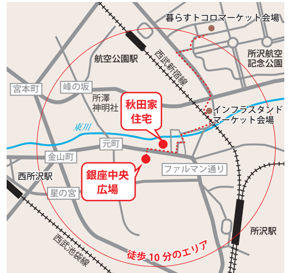
◎「暮らすトコロマーケット」（所沢航空記念公園）、「インフラスタンドマーケット会場」（西新井町）も同日開催します。