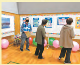
▲SDGsカラーに彩られた会場