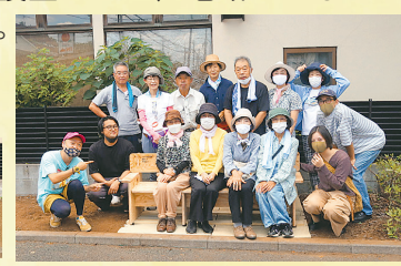
▲手作りベンチと、山口を考える会の皆さん

これから地域の一一人の声を大切に、皆で知恵を出し合い、ともに考えながら「できること」を実践していきます!