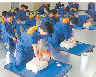
▲ AEDを使った心肺蘇生法

消防活動はいきなりできるものではありません。本業の傍ら平日の夜や週末に、訓練・研修・会議に参加することで、経験や知識を積み重ね、地域で力を発揮できるのです。