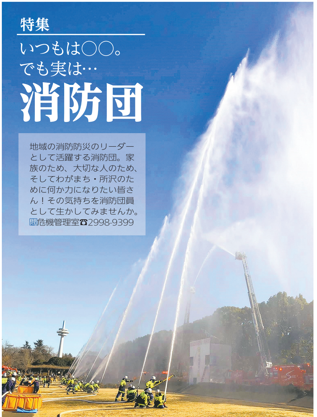
消防出初式での一斉放水(所沢航空記念公園)

地域の消防防災のリーダーとして活躍する消防団。家族のため、大切な人のため、そしてわがまち・所沢のために何か力になりたい皆さん!その気持ちを消防団員として生かしてみませんか。 固危機管理室 ☎2998-9399