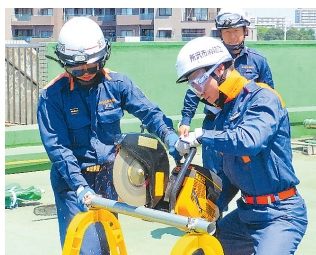
▲ エンジンカッター取扱訓練

市庁舎(Q)HEATOCO)で消防団の活動などを紹介する広報誌「HEATOCO」をご覧ください。