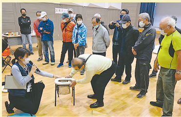
▲簡易トイレを組み立て中

い つ起こるかかわからない自然災害。いざという時に備え、新所沢まちづくり協議会では「災害グッズ展示体験会」を開催し、自治会・町会の役員や防災担当者が避難所備品の使用方法を学びました。緊急時には担架に変わるベンチ「レスキューボードベンチ」や、簡易トイレの組み立て、さらに普段は見ることのない、空気で膨らむ「巨大避難用テント」の設営を実際に体験。あらかじめ使い方をしておくことで、避難所での実践に備えます。