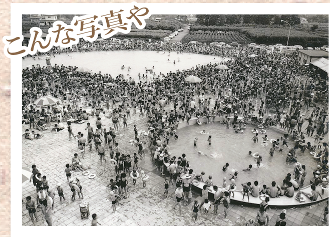
▲市民プール…前年にオープンした市民待望のプールは、たくさんの人でにぎわいました（昭和48年7月8日）

◆ふるさと研究活動 同センターでは、ボランティアの市民学芸員と一緒に「ふるさと所沢」の自然、歴史、民俗などの資料を収集・保存し、調査・研究した成果を、展示や講座、体験学習会などで広く紹介しています。