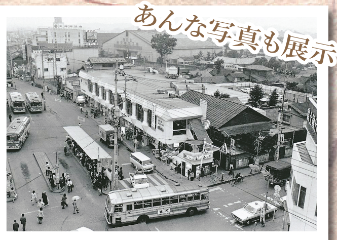
▲所沢駅西口前…時を経て、今では大型店舗ができて様変わりしました（昭和49年10月撮影）