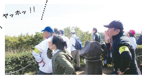
▲「ヤッホポイント」では仲間と声を合わせて「ヤッホッ!!」の掛け声

と見渡し景色を満喫できる「ヤッホポイント」で心洗われること間違いなし。人と自然が共生するまち「エコタウン所沢」ならではの豊かな緑をお楽しみください!