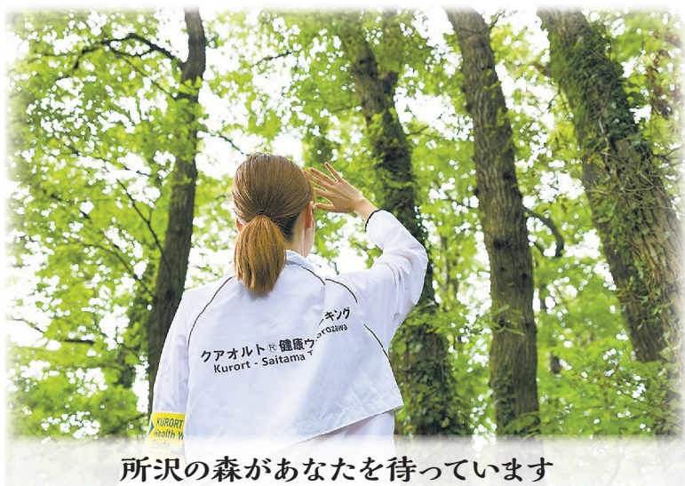
所沢の森があなたを待っています