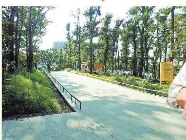
▲木漏れ日がさす広々とした空間に生まれ変わりました