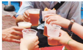
所沢の三酒で カンパ〜い♪