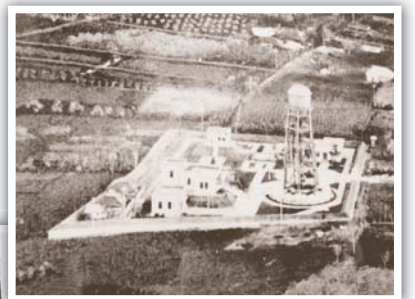
▶所沢初の浄水場 (現在の第一浄水場/宮本町)

水が枯れてしまうこともありました。昭和9年、所沢は大干ばつに見舞われ、飲み水の確保さえ難しい状況に。これをきっかけに所沢町の上水道の建設が始まり、昭和12年(1937年)4月、ついに人々が待ち望んでいた水道の給水が始まったのです。