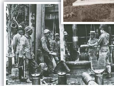
◀水道建設工事の様子(上記浄水場内・第一号取水井)