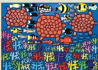
▲受賞作「阿嘉島の海」

作業所に通うかわら、こよなく愛する沖縄の海や花を描く。豊かな色彩が高い評価を得て、「てんかんをめぐるアート展」で満場一致の審査員賞に。今冬、所沢での個展を初開催する。