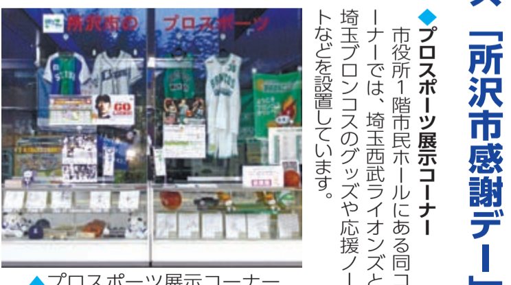
▲プロスポーツ展示コーナー

5月20日(月)午後6時試合開始(阪神タイガース戦) 場内在任・在勤・在学の方 チケット代金 1,200円(大人・子ども共通) チケット購入 市内在住・在勤・在学が分かるもの(運転免許証、健康保険証、社員証、学生証など)を提示の上▼ライオンズストア@所沢ステーション(所沢駅構内)▼西武ドームチケットセンターで購入(1人6枚まで購入可能) ◎座席は内野指定席Cです。指定席が満席の場合は他の席種になる場合があります。 ◆商業観光課 ☎ 2998-9155