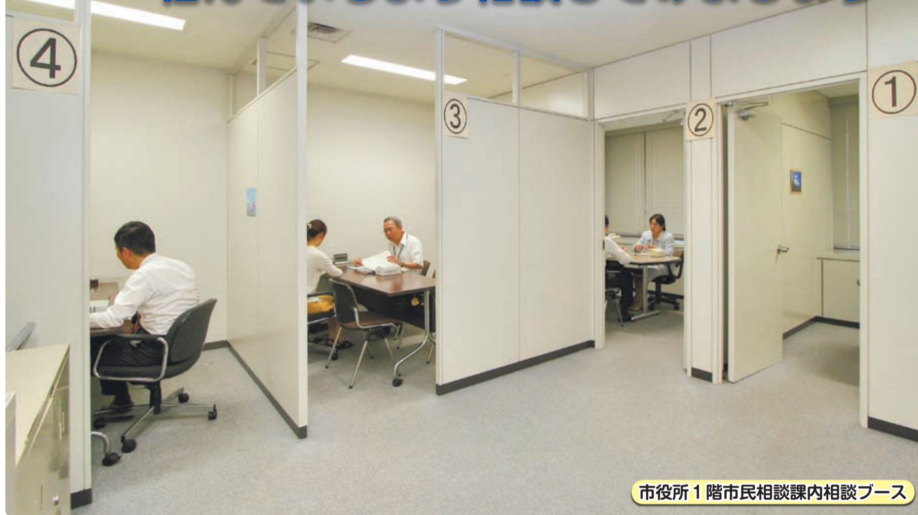
市役所1階市民相談課内相談ブース

人は誰でも悩みやトラブルのない人生をおくりたいと望んでいるのではないのでしょうか。その反面、現代社会は複雑で変化が速く、ストレスや困難な問題を抱え、苦しんでしまうケースも少なくないと思われまふ。