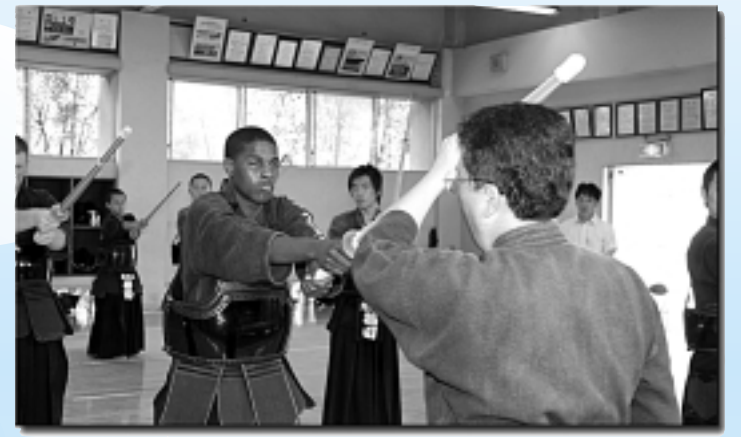
▲米国ディケイター市の高校生5人が、剣道を体験し、日本の文化と精神に触れた「姉妹都市学生交流事業」 8月3日(金)／県立所沢北高等学校