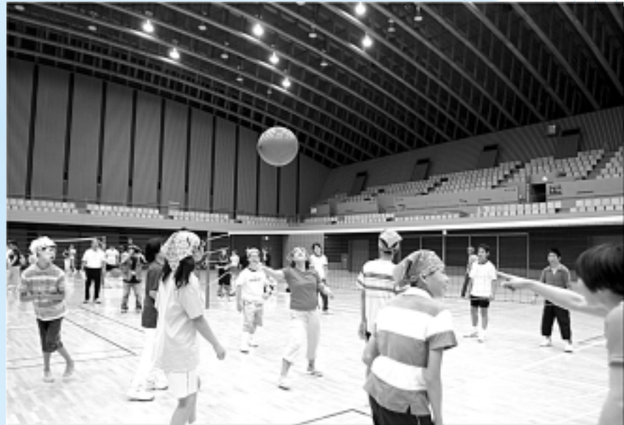
▲ゴム風船をボールにした『風船バレー』では、白熱した熱戦が繰り広げられました。楽しく盛り上がった「第3回障害者スポーツ室内大会」 7月29日(日)／市民体育館