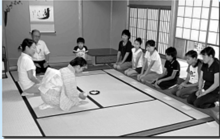
▲初めて茶道の作法を体験した「子どもたちのお茶会」では、抹茶やお菓子のいただき方を学びました。 7月21日(土)／航空記念公園内・彩翔亭