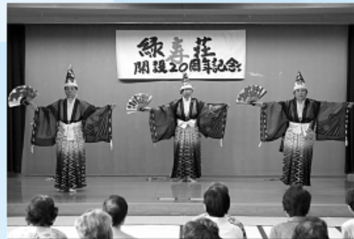
▲利用者が、祝いの詩や舞で感謝の気持ちを表現した「緑寿荘開設20周年記念式典」。当日は、『所沢のだからもの』と題した記念講演も行われました。 8月4日(土)／緑寿荘