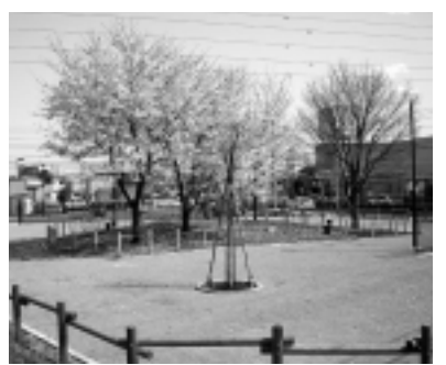
所在地 上新井1055-1 面積 1,300㎡