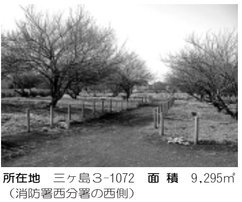
所在地 三ヶ島3-1072 面積 9,295㎡ (消防署西分署の西側)