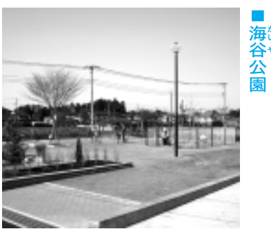
所在地 小手指南5-4 面積 2,248㎡