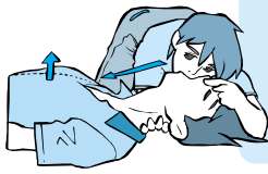
内容 心肺蘇生法(人工呼吸、心臓マッサージ、AEDの使用法)、止血法、傷病者管理法、外傷の手当要領、傷病者搬送法等