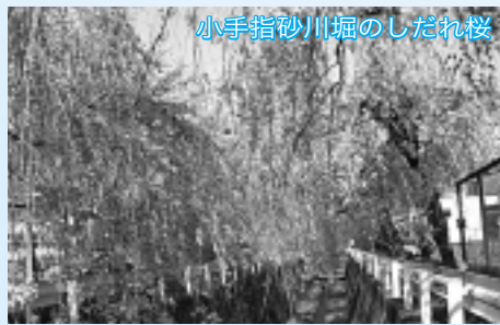
小手指砂川堀のしだれ桜