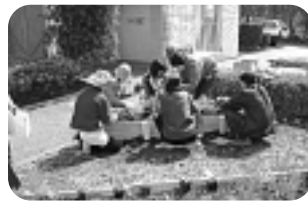
ハーブの手入れ方法や植え替え・補植などについての説明▶ハーブ類の利用方法の紹介▶季節に応じて植え付けたハーブ類とふれあいながらの楽しい花壇づくり

対象 地域緑化に関心のある方(ただし、小・中学生を優先) ◎いずれも、徒歩または自転車等で参加できる方に限ります。