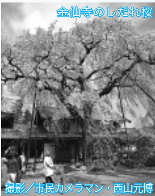
金仙寺のしだれ桜

申し込み はがきに、①代表者氏名②住所③郵便番号④電話番号⑤参加希望日(第1・2希望)⑥大人・子どもの参加人数を記入のうえ、3月1日(木)から16日(金)(消印有効)までに、ジェイティ―ビー首都圏所沢支店団体営業係(〒359-1123・日吉町18-26/☎2924-1145)へ郵送