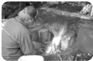
対象 小学生以上の方(小学生は保護者と参加)、大人

集合 狭山丘陵いきものふれあいの里センター(荒幡782) 参加費 200円(保険代・資料代)