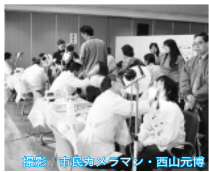
▲昨年の健康まつり… 歯科医師による相談の様子

不要な和服がありましたら、リサイクルふれあい館・東所沢エコステーション・廃棄物対策課へお持ちください。 ●リサイクルふれあい館・エコロ（日比田620-1/☎2994-5374・FAX2994-1118） …月曜日、祝休日（月曜日と重なる場合、その翌日も含む）、年末年始を除く毎日/午前8時30分～午後5時 ●東所沢エコステーション（東所沢和田2-23-6/お問い合わせはリサイクルふれあい館へ）…月曜日、祝休日（月曜日と重なる場合、その翌日も含む）、年末年始を除く毎日/午前9時～正午、午後1時～3時 ◎東所沢エコステーションでは、古着・古布・陶磁器の受け入れを随時行っています。 問い合わせ リサイクルふれあい館（☎2994-5374・FAX2994-1118）