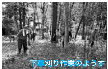
下草刈り作業の様子

雑木林の手入れ作業を体験しませんか。林の中で汗をかくのは、気持ちのよいものです。中学生以上の方は、ごな