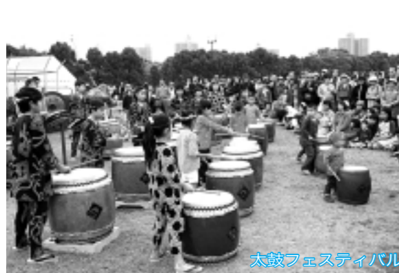
太鼓フェスティバル

内容 特設ステージを使用した自由な表現活動 参加資格 市内在住・在勤の個人または団体