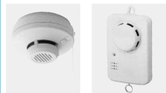
《天井付け型の例》 《壁付け型の例》