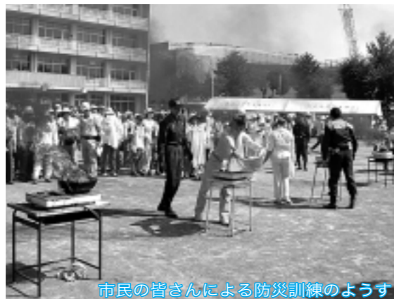
市民の皆さんによる防災訓練の様子

昨年は、新潟・福島・福井での豪雨災害、次々と上陸した台風、そして新潟県中越地震等、全国各地で相次いで起こった大規模な自然災害によって、各地に大きな被害をもたらされました。また、本年3月20日に発生した福岡県西方沖地震は、これまで「地震はない(あるいは少ない)」とされた地域で発生しています。