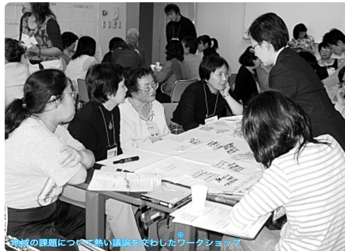
※ ワークショップとは…共通の体験・共同作業を行い、相互理解と新しい発見を重ね、問題解決を図っていく手法です。

市では、市民の皆さんが家庭や地域で、その人らしく安心して自立した生活ができるよう支えていくことを目的に、地域福祉の総合的、計画的な推進を図るため、所沢市地域福祉計画策定事業を進めています。 今回は、同計画への取り組みや同計画地域づくりモデル事業(三ヶ島地区)に参加した市民の皆さんの活動などについてお知らせします。 ※問い合わせ 福祉総務課(☎2998-9113・FAX2998-9035)