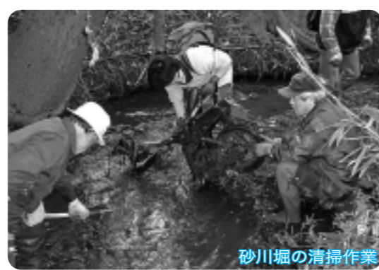
砂川堀の清掃作業

●活動テーマの決定と計画 まずは、4月から5回のワークショップで、三ヶ島地区の現状把握、地域の課題に対する取り組みについて話し合いました。 ここで提起されたそれぞれの課題を、「高齢者・障害者」「身近な交流とボランティア」「道とみどりの3つのテーマに分類し、それぞれのテーマごとに分類して、12月までの間、実践活動を行うことになりました。 ●各グループの活動紹介 実際に取り組んだ活動内容は、次のようなものです。 ●四ツ葉のクローバー お年寄りの方や障害者を持つている方等、さまざまな方が集まり交流できる場所を作りたいとの思いから活動を始めました。 早稲田大学所沢キャンパスで学生の皆さんと協働して、交流イベント(ふれあいデー)を開催しました。 ●グリーンティ ボランティア活動の方法と、地域のボランティア情報を掲載した情報紙「ちやちや」を作成し、地域の公共施設などに配布しました。 ●緑と小川の会 三ヶ島地区内を流れる砂川堀流域マップの作成とともに、地域のボランティアグループが行っていた川の清掃作業へ参加しました。