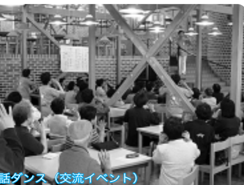
手話ダンス(交流イベント)

計画策定に当たっては、「地域福祉計画策定懇話会」と「地域福祉計画地域づくりモデル事業」を並行して行っています。 そのうえで、「地域福祉計画策定委員会」は市民の皆さんの自主的な活動によって明らかとなる地域の課題や対策を集約し、皆さんの主体的な参加による計画として現実に即した行政計画となるように策定していきます。 以上ことから、「地域福祉計画地域づくりモデル事業」は、同計画の策定に必要な不可欠な柱として位置づけられます。 ●地域福祉計画の位置づけは 地域福祉計画は、生活の拠点である地域社会を基盤とした福祉を推進するために策定した市の福祉の3つのプランである「障害者計画」「児童育成環境整備計画(エンゼルプラン)」「高齢者保健福祉計画・介護保険事業計画」に定められた福祉施策を中心に、地域福祉の土台となる情報提供・相談体制の整備・事業者育成・サービス向上等、共通の施策や理念を定め、それを具体的な形で表し、支え合いの地域づくりを目指す。 ●地域福祉計画地域づくりモデル事業とは 市では、地域福祉計画の策定に先駆けて、平成15年度4月から三ヶ島地区で地域福祉計画地域づくりモデル事業を実施してきました。この事業は、「安心して暮らし続けることができる地域を自分たちでつくる」という思いを具体的に実践してみようという試みで、三ヶ島地区に在住・在勤・在学の皆さんを対象に呼びかけ、20歳代から70歳代までの方がこの活動に参加しています。