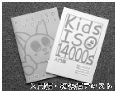
入門編・初級編テキスト

プログラムには入門編と初級編があり、市では昨年の冬休みに、市内3つの小学校（101人）で入門編の試験導入を行い、プログラムの実施効果を確認しました。