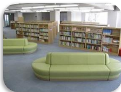
新所沢分館フロア