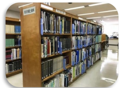
本館3階郷土資料コーナー

生涯学習推進センター、市政情報センター等の関係機関とも連携・協力し、迅速で効果的な収集・保存に努め、市民への資料提供を行います。