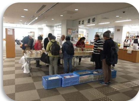
所沢分館 ブックリサイクル

地域で大人同士の読書会を実施しているグループや、文庫活動を行っている団体などに対し、団体貸出として本を提供することにより、図書館外でも本に触れることのできる環境や読書に関わる取り組みの充実を図れるように、地域活動を支援していきます。