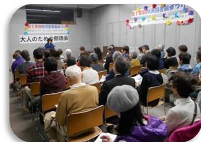
図書館まつり「大人のための朗読会」

また、市内各館で、受け入れ態勢・活動環境等の整備を行い、市民がその成果を十分に発揮できるよう努めます。