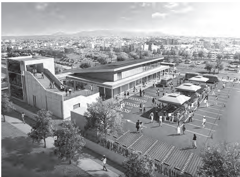
所沢市観光情報・物産館「YOT-TOKO (よっとこ)」 「寄ってほしい」と「所沢」を掛け合わせた、公募で選ばれた愛称で、市特産の狭山茶や野菜のほか、入間・狭山・日高など周辺自治体の特産品を販売予定