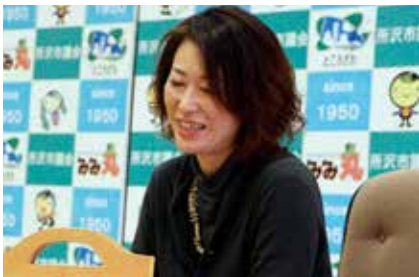
福岡県大野城市生まれ。2000年から所沢市に在住。グラフィックデザインを学んだ後、編集プロダクションに約8年間勤務し、その後、結婚や出産を経て2013年に「きびるアクション」を開業。バッグの制作販売やイベントの企画を行っている。2019年から障害者福祉施設との協業をスタート。

「障害者が作っているから買ってください」という考え方は、活動を続けられないと思います。もっとおしゃやかに、ファッションナブルで斬新な商品を開発して、作る人も使う人も幸せになるバッグをこれからも作り続けたいです。