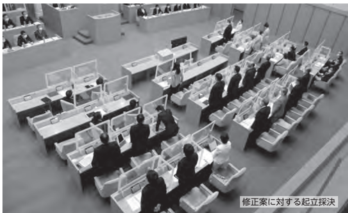
修正案に対する起立採決