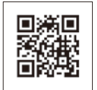
所沢ブランド 特産品

狭山丘陵をはじめとした豊かな自然、航空発祥の地、プロスポーツ、狭山茶やサトイモなどの農産物を 所沢らしい お土産の「所沢ブランド特産品」として、所沢市でしか味わえない魅力の発信を行いイメージを向上させます。