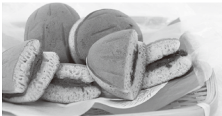
▲所沢どら焼き 里のアロマ(所沢ブランド特産品)