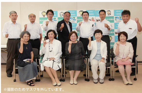
※撮影のためマスクを外しています。

市民の皆さんと歩んだ51年。これからも1ページ1ページに市議会のアツい想いを込めてお届けします！