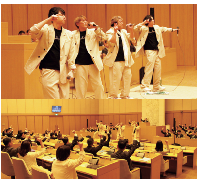
令和5年12月定例会の開会に先立ち開催した議場コンサートに出演

ライブハウスとライブもできるレストランを経営しています。コロナの影響で閉店したライブハウスも多いので、お客さんの前にアーティストが立って喜んでもらえる居場所を市内に一つでも多くつくりたいです。