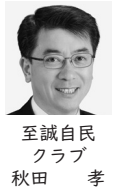
至誠 自 民 秋田 孝

Q 川越市では小中学校全54校の体育館の空調設備の熱源を、停電時でも稼働できるLPガスにした。本市は11行政区あるので、最低でも各行政区に一つはLPガスを使用した避難所が必要である。市長も選挙公報に、市内全小中学校の体育館にエアコン設置、子どもたちが快適に学べる環境を整備するだけでなく、地域の方にも利用しやすくする A 近年の記録的な猛暑を受け、児童生徒の学習環境の向上に加え、災害時の避難所としての機能を考慮したエアコン設置を進めるため、教育委員会と協議し、検討していきたい。