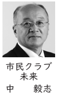
市民クラブ 未来 中 毅志

Q 市長の公約には、70歳以上の方のところバス、ところワゴンの無料化が掲げられている。現在、利用者が増加傾向にあるところワゴンだが、今後、地域の公共交通として、様々な事業展開を行っていくのか、市長の見解を伺う。 A 令和3年4月に実証運行として開始した三ヶ島地区ところワゴンだが、利用者が年々増加しており、地域の移動手段として定着したものと考えている。実証運行が終了する令和6年4月以降もところワゴンを行い、地域住民や三ヶ島地区を訪れる方の移動手段として活用してもらいたいと考えている。公共交通の今後の事業展開だが、公約に掲げた、70歳以上の方のところバス、ところワゴンの無料化をはじめ、誰もが気軽にかけられ、笑顔で生き生きと生活できるように、公共交通を充実させていきたいと考えている。