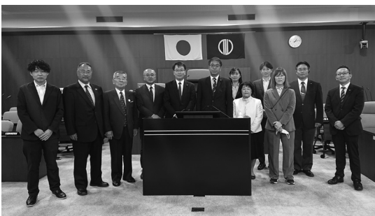
宮城県仙台市議会