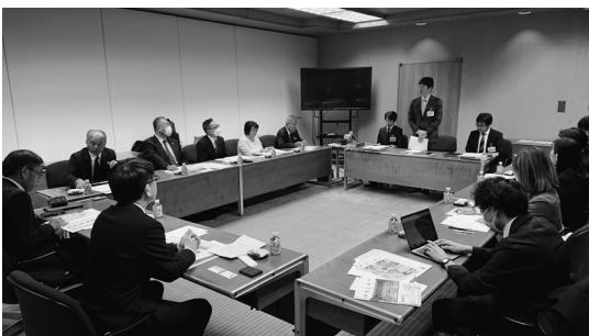
山形県山形市議会

仙台市議会は、子ども議会を始めてから20年ほど経ちますが、子ども議会に参加し、市議会議員や行政職員になった方がおそらくいると思います。その追跡調査を行うことは難しいと思いますが、何かしらの形で子ども議会に参加した児童生徒のその後が分かるような仕組みづくりができれば、より素晴らしいものになると感じました。