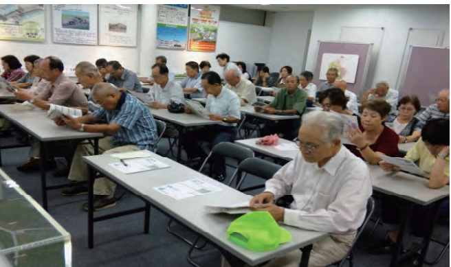
埼玉県環境整備センター研修

3号埋立地の様子は雨天の為、バスの中から職員の説明を聞きながら熱心に見学しました。