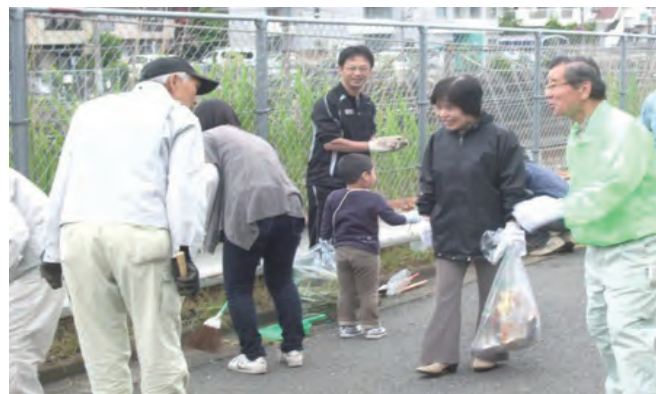
当麻市長と松本会長も一緒になって