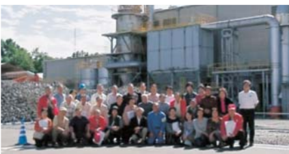
焼却灰の溶融資源焼却化プロセスを見学（H27メルテック社訪問）

“とことん減量”を合言葉に、3R推進を目的とした啓発・実践活動を行っています。「もったいない市」や研修会等の各種環境行事にはいつも大勢の推進員が参加、楽しい雰囲気、でコミュニティ活動を行っています。