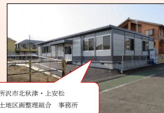
所沢市北秋津・上安松 土地区画整理組合 事務所