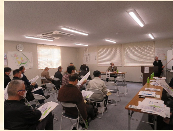
工事概要の説明をしている様子