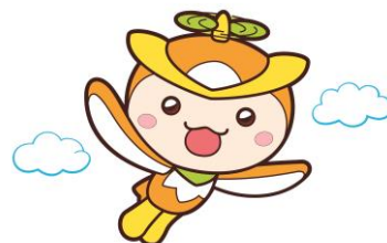
所沢市イメージマスコット 「トコロん」