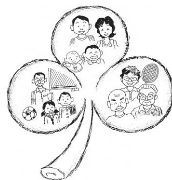
三つ葉の提言 家庭・地域・学校

この概要版は「三つ葉の提言」の基本的事項を記述したもので、具体的な行動目標は裏面のとおりです。詳しい提言は冊子になっていますので、興味のある方は、市役所青少年課窓口、または所沢市のHPにてご覧ください。