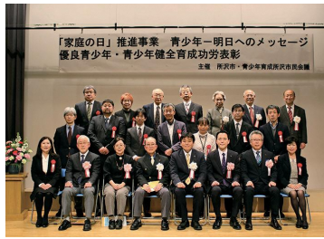
青少年健全育成成功労受賞者