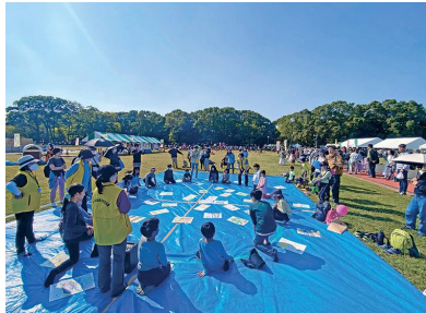
当日の様子（所沢航空記念公園）

令和5年10月28日（土）、29日（日）、所沢市民フェスティバルにて「所沢郷土かるた大会」を開催しました。