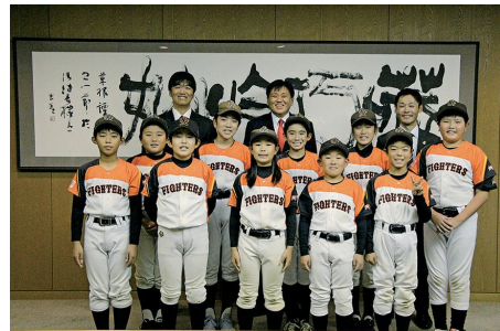
全国大会に出場した選手・コーチと小野塚市長