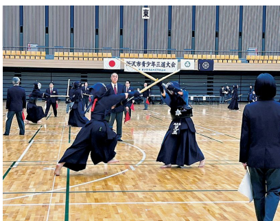
剣道の部（所沢市民体育館）