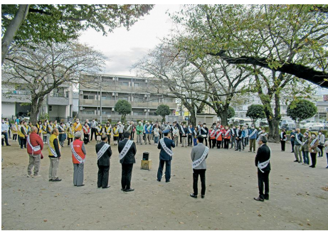
開会式の様子(所沢駅東口長者久保公園)

このキャンペーンにご協力 いただいている市民会議以外 の各団体をご紹介します。 所沢警察署◇所沢市教育委 員会◇安全・安心な学校と地 域づくり推進本部◇所沢市防 犯協会◇所沢市自治連合会◇ 所沢昭和会◇所沢ファルマン 通り商店街◇所沢日栄会協同 組合◇所沢市学校警察連絡協 議会◇所沢販売防犯連絡協 会◇NPO法人 日本ガー ディアン・エンジェルズ◇埼 玉県西部地域振興センター ご協力ありがとうございました。 今後ともよろしくお願 いいたします。