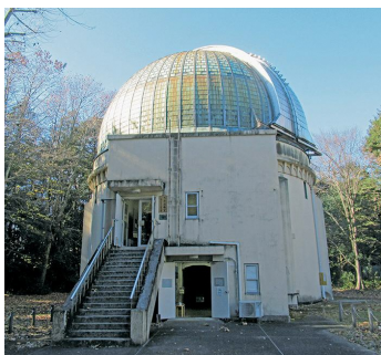
天文台歴史館（国立天文台）

国立天文台は、自然に囲まれた敷地の中にあり、その中の7つの建物が有形文化財となっており、大正15年に完成した天文台歴史館の木造ドーム部分は、造船所の技師の支援を得て作られたそうで、中から見上げた光景は大変美しく感動しました。その他にも樹々に囲まれた洋風の建物や何年も前に使われていた望遠鏡、星と森と絵本の家にも歴史を感じました。