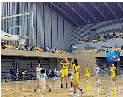
決勝戦の様子（女子の部）