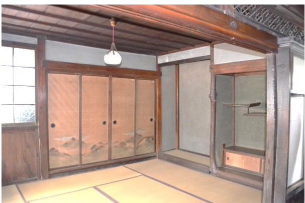
秋田家住宅「店舗兼主屋」（2 階座敷）

「店舗兼主屋」は、1 階前半部の店の開口を広めて格子戸をたて、切妻造の 2 階を東に寄せ、上下階とも出桁造で軒先まで銅板を張り、防火を講じる特徴的な外観をもっています。2 階には瀟洒な造作の座敷を設け、織物業で栄えた所沢のまちばの面影を今に伝えます。