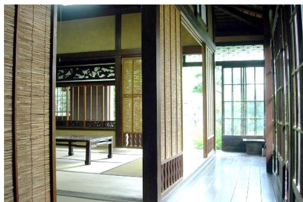
秋田家住宅「離れ」（主室と矩の手に廻る縁）

土蔵の北側に建つ「離れ」は、8 畳の主室と次の間に縁を廻らせています。主室は座敷飾りを備え、床柱などに良材を用い、堅実な仕上げの書院としています。矩の手に廻る縁は、ガラス戸をたて、組子のガラス欄間を飾るなど、気品のある造作です。大正元年 11 月の陸軍特別大演習の際に、伏見宮貞愛親王が宿泊されました。